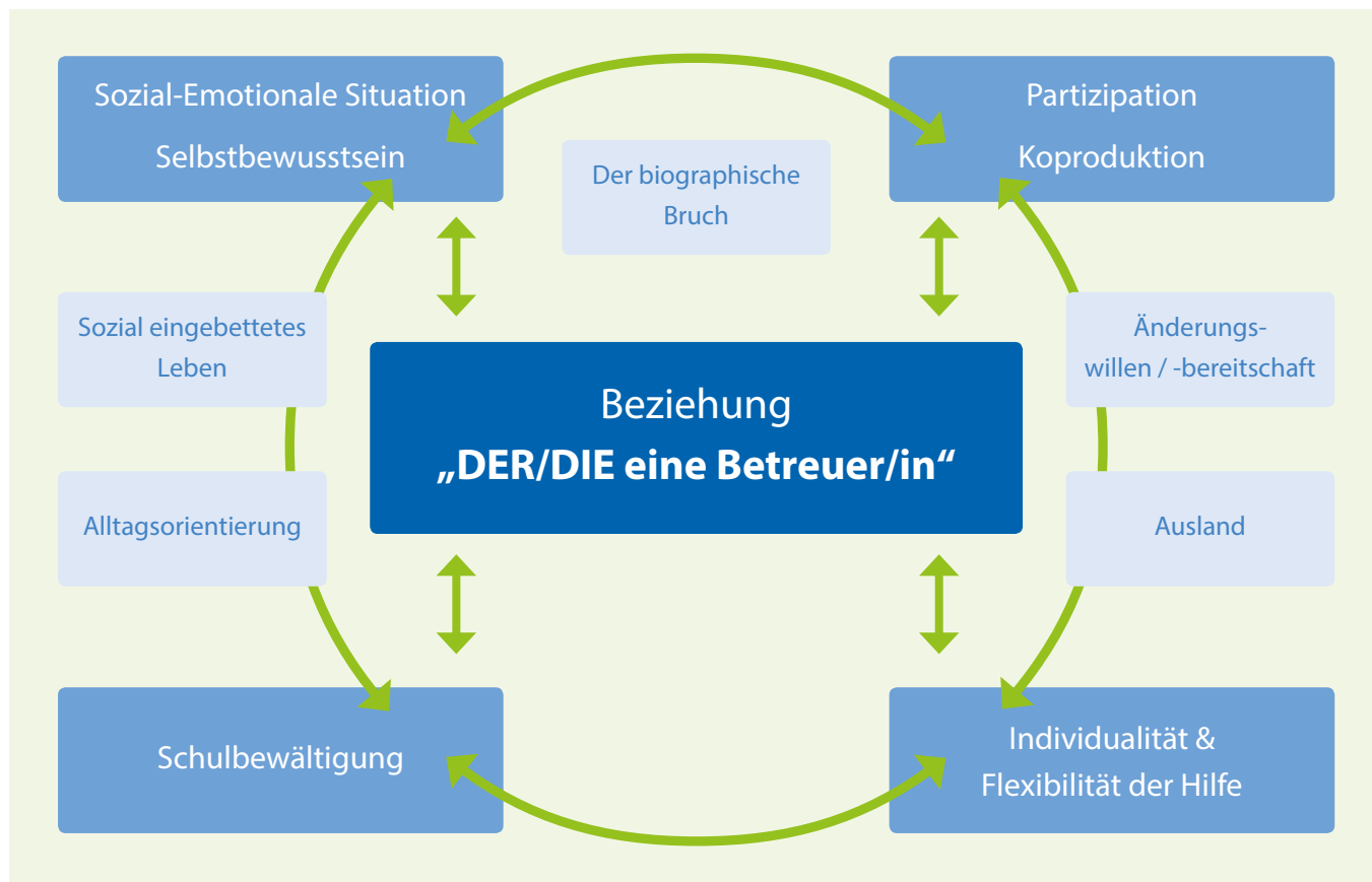
Abbildung 4: Der Haupt-Wirkfaktor, zentrale Wirkfaktoren, erweiterte Wirkfaktoren und deren Wechselwirkungen (eigene Grafik)

In den vorherigen Kapiteln beschrieb ich die Sichtweisen der ehemaligen Betreuten des Projektes „Neue Horizonte“ hinsichtlich des Haupt-Wirkfaktors und den zentralen Wirkfaktoren. Es gibt jedoch noch weitere Faktoren, die für ein Gelingen bzw. Scheitern von Betreuungsverläufen eine wichtige Rolle spielen. ‚Der biografische Bruch‘, ‚Änderungswillen / Änderungsbereitschaft‘, ‚Ausland‘, ‚Alltagsorientierung‘ und ‚Sozial eingebettetes Leben‘ stellen diese erweiterten Wirkfaktoren dar und sind in der Abbildung 4 nun eingefügt.