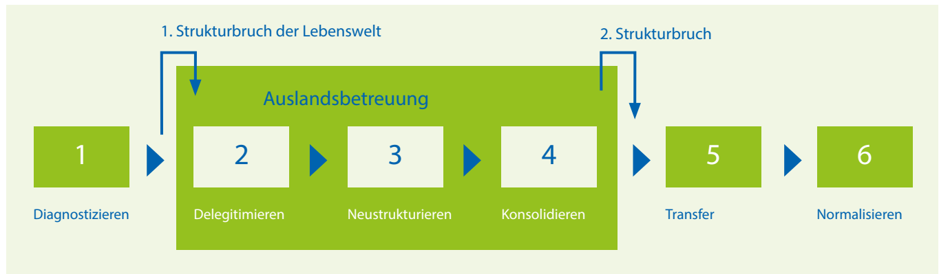
Abbildung 1: Phasenmodell der intensivpädagogischen Auslandsbetreuung nach Villanyi und Witte (Villanyi, Witte in: Witte, M., Sander, U. (Hrsg.) (2006), S.38).

Villanyi und Witte (2006) haben ein in sechs Phasen unterteiltes Modell entwickelt, welches in plausiblen Strukturabschnitten die Phasen einer intensivpädagogischen Auslandsbetreuung nachzeichnet. Besonders bemerkenswert erscheint, dass die eigentliche Auslandsbetreuung nicht den Anfang und das Ende der intensivpädagogischen Maßnahme beschreibt. Der Anfang und das Ende der Auslandsbetreuung ist jeweils durch einen Strukturbruch der Lebenswelt gekennzeichnet, dessen Gestaltung und Moderation als besonders wichtig für das Gelingen einer intensivpädagogischen Auslandsmaßnahme gilt (vgl. Villanyi, Witte in: Witte, M., Sander, U. (Hrsg.) (2006), S.37f).